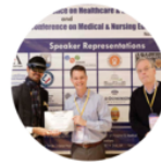
Medical Conference Vienna