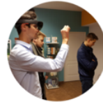
Work Shop Warsaw