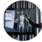
Belgian Days Warsaw