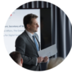
Belgian Days Warsaw