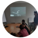
Work Shop Ghent University