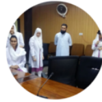
Work Shop Pakistan