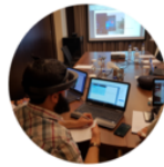
Work Shop Dubai