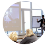
Medical Conference Vienna