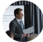
Belgian Days Warsaw