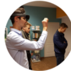
Work Shop Warsaw