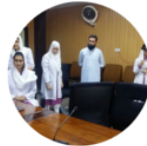
Work Shop Pakistan