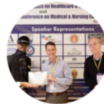
Medical Conference Vienna