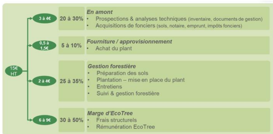
Éventail du prix de vente d'un arbre à 15€ (standard)